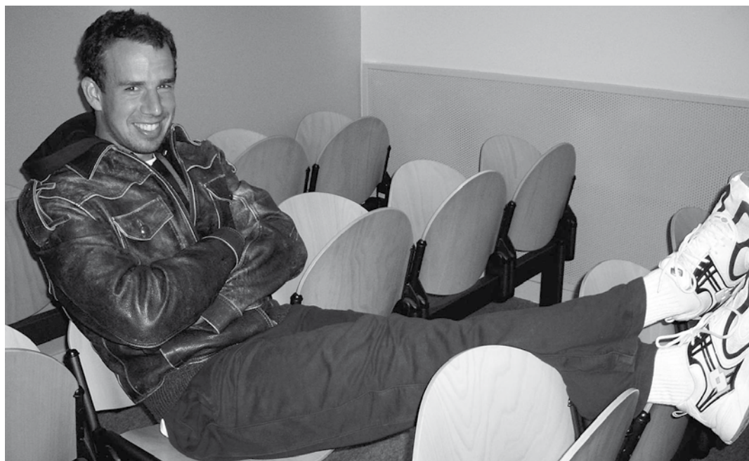
Dominik HRBATÝ relaxuje v miestnosti pre tlačové konferencie na Roland Garros

Martina Suchá bola v Paríži jedinou slovenskou hráčkou, ktorej sa nechcelo komunikovať s médiami pred prvým kolom. Po nečakanom odmietnutí je pre ňu poľahčujúcou okolnosťou neľahký žreb prvého kola – Ruska Jelena Dementievová, finalistka spreď dvoch rokov, a sku-