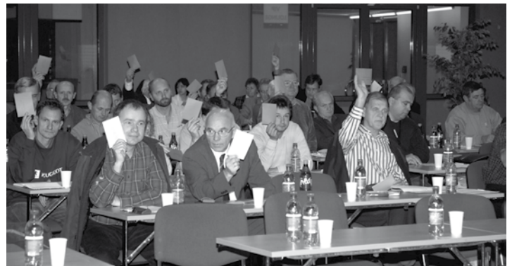
Delegáti Kongresu STZ 17. novembra 2006