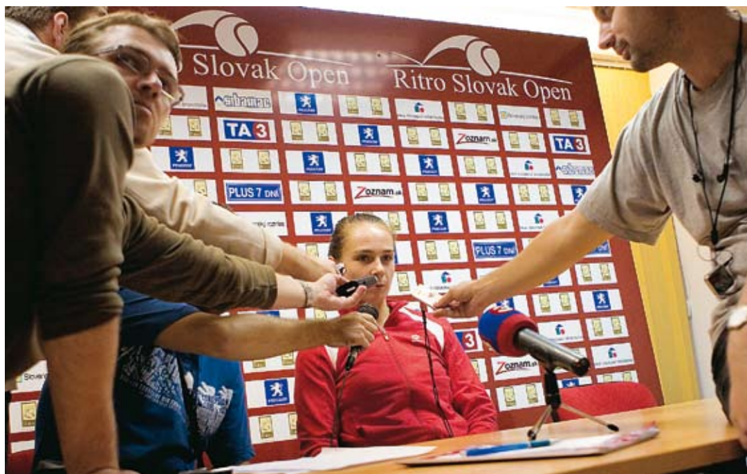
Na Ritro Slovak Open 2008 bola Magdaléna RYBÁRIKOVÁ, ako rok predtým, najúspešnejšia domáca hráčka

Talentu mám viac ako pracovitosti. Spočiatku som sa spoliehala najviac na svoj talent, z ktorého som ťažila. Čím som však staršia, tým viac si uvedomujem, že bez pracovitosti a tvrdej roboty sa nebudem zlepšovať. Asi nebudem schopná drieť ako Dominik Hrbatý. Pravda, je mi jasné, že talent v profesionálnom tenise nestačí. Treba veľa pracovať.