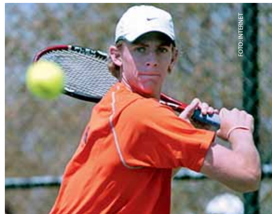
Juhoafričan Kevin ANDERSON