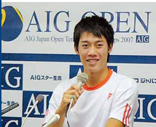
Japonec Kei NIŠIKORI