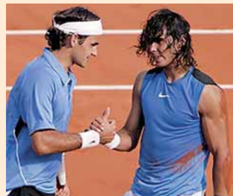
Roger FEDERER a Rafael NADAL

Tretí v poradí, Novak Djokovič, víťaz Australian Open, mal ku koncu roka na Federera stratu 2710 bodov. Pred turnajom série Masters v Indian Wells to bolo už len 1200 bodov. Pravda, srbského tenistu, zverenca slovenského trénera