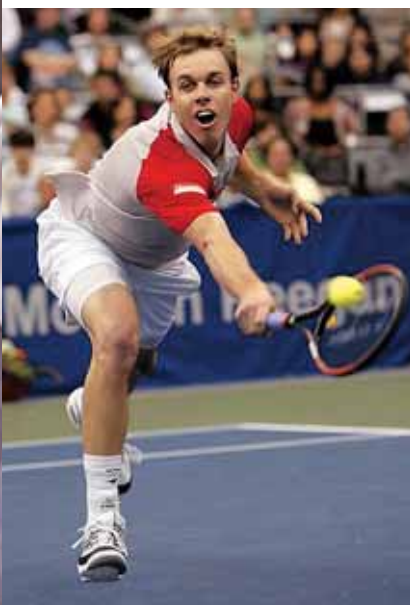
Sam QUERREY patrí medzi najväčšie nádeje amerického tenisu

Najbežnejšou príčinou nedostatočnej rýchlosti sú vrodené pomalé svalové vlákna. Vieme, ako tréningom premeniť rýchle vlákna na pomalé, ale obrátene – pomalé na rýchle vlákna – to doteraz nevieme. Niekedy je špeciálny mentálny tréning najlepšou zbraňou, ako v krátkom čase skratiť únavu hráča, než klasický kondičný tréning. A tiež naopak – nervózny hráč bude skôr unavený!