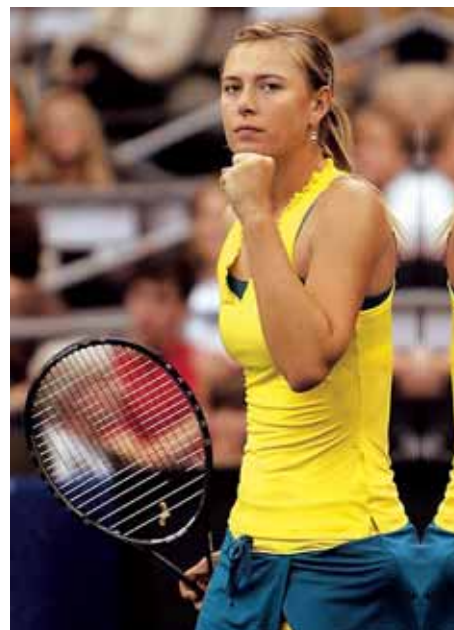
Maria ŠARAPOVÁ, bývalá svetová jednotka, je po dlhodobom zranení späť – už atakuje svetovú desiatku

Týchto pár poznámok si nerobí nárok na úplnosť. A neberte všetko, čo som tu napísal, za nezvratné fakty. Niekedy sú to iba kvalifikované úvahy, hypotézy, ba teórie, ktoré čakajú na potvrdenie v praxi. Ale v každom prípade prispeli už dnes k väčšej vierohodnosti pri prognóze tenisových talentov. Každý seriózný súťažný tréning musí zahrňovať výskum a využitie vrodených limitov rozhodujúcich u faktorov tenisovej výkonnosti. Hráči, a tiež ich rodičia, nesmú žiť vo falošnej nádeji na úspech a beznádejní juniori musia byť čo najskôr vylúčení z kádrového tréningu, k prospechu všetkých. A nebojte sa, že využitie hypotézy vrodených limitov vám skomplikuje vašu prácu na dvorci. Veď už vy vlastne v duchu tejto hypotézy pracujete tým, že hľadáte slabiny vašich žiakov a tieto slabiny chcete odstrániť. Hypotéza dá vašej práci viac systematickosti, pravidelnosti. A trufám si tvrdiť, že i viac vedeckosti. Od hypotézy vrodených limitov si sľubujem podstatnú, revolučnú zmenu v práci tenisových učiteľov, trénerov a koučov.