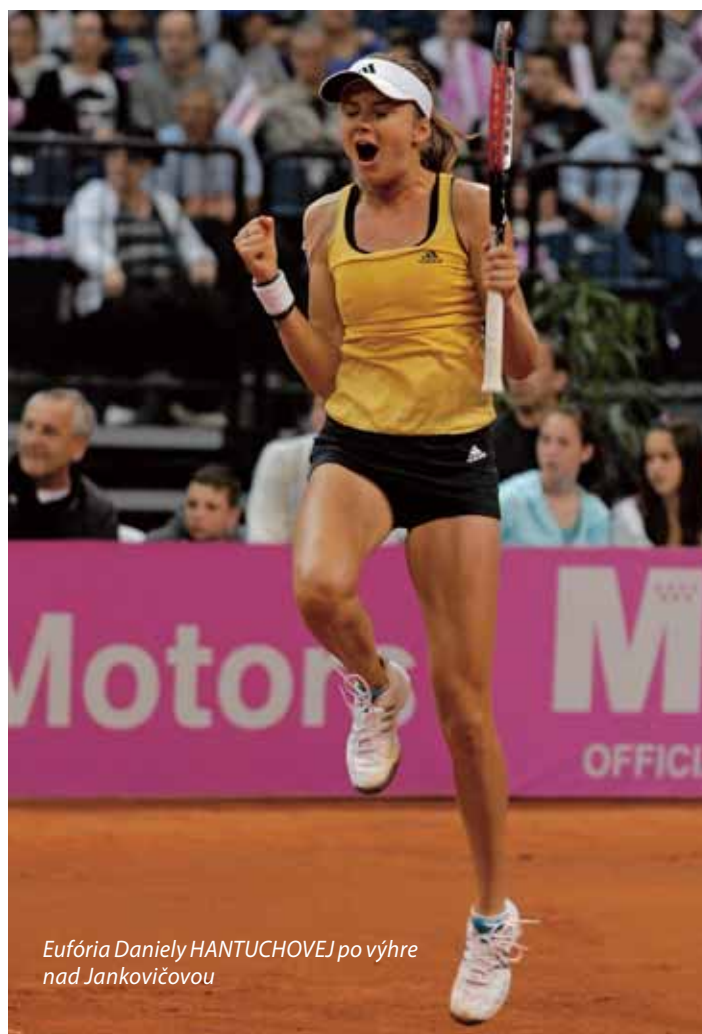
Eufória Daniely HANTUCHOVEJ po výhre nad Jankovičovou