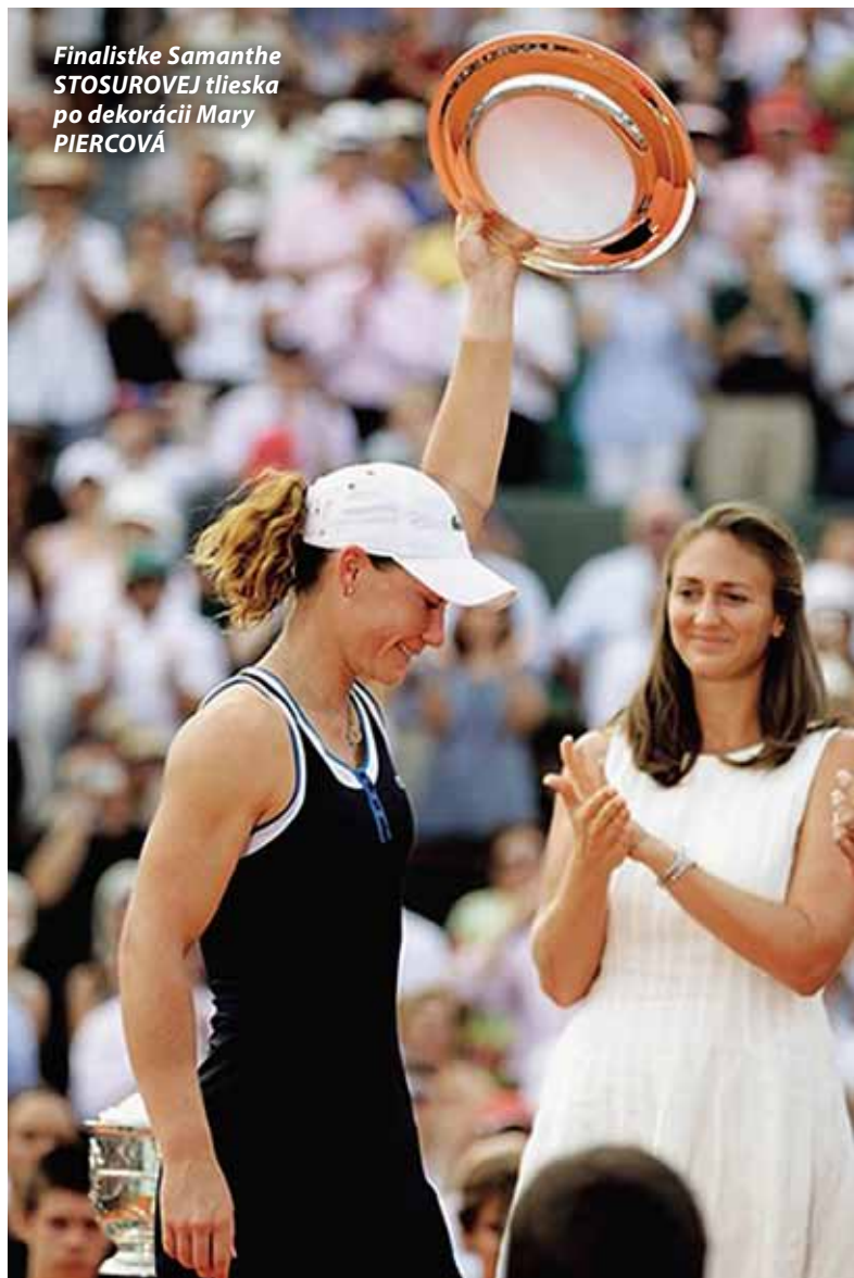
Finalistke Samanthe STOSUROVEJ tleska po dekorácii Mary PIERCOVÁ

Talianku Francescu Schiavoneovú (17.). Vlnami cunami, ktoré spôsobila, postupne zničila za 687 minút Rusku Kulikovovú, Austrálčanku Fergusonovú, Číňanaku Na Li (11.), Rusku Kirilenkovú (30.), Dánku Wozniackú (3.), Rusku Dementievovú (5.) jej vzdala pre zranenie a napokon zdolala aj Stosurovú (7.). O jediný set ju pritom obrala iba Kulikovová! Tomu sa povie suverenita! Vyplynula z výborného pohybu, prehľadu pri sieti, prestrej celodvorcovej hry a v poslednom rade aj z určitej bezstarostnosti, lebo si nelámala hlavu nad tým, kam to až dotiahne. Možno aj preto vyhrala so Stosurovou i druhý set, hoci v ňom prehrávala 1:4. Ale to, že sa - ako prvá Talianka v histórii - stane v jej veku víťazkou grandslamového turnaja, sa jej ani neprišlo. O to väčšia bola jej radosť. (-rik)